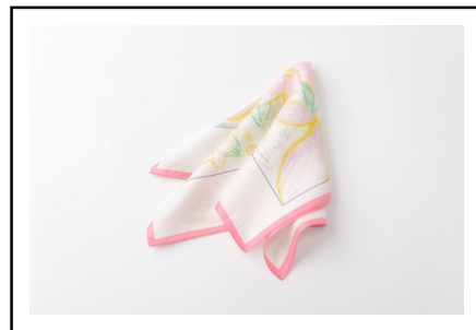
サクラの優しさを表現した デザイン